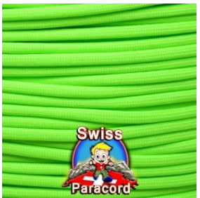
hyper neon green (+)