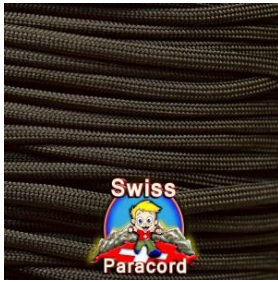
acid dark brown