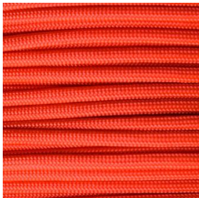
Neon orange I / II