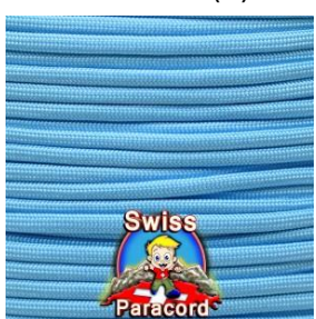
carolina blue (+)