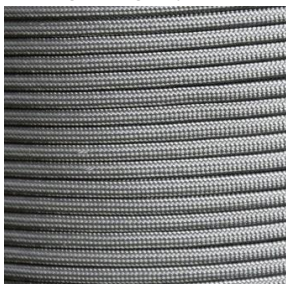
charcoal grey I / II