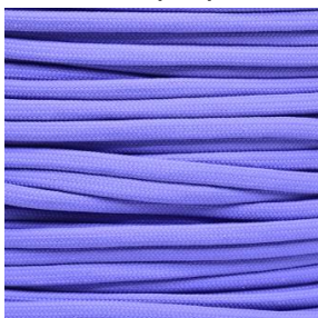
Lavender purple II