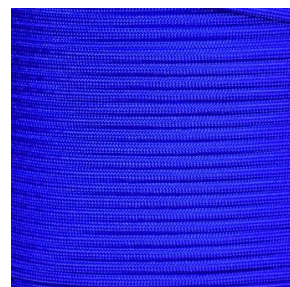
electric blue I / II