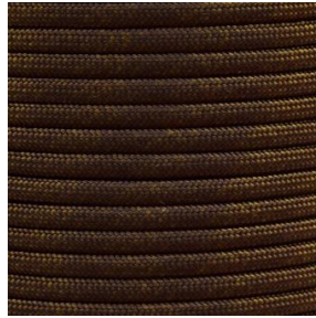
walnut I / II