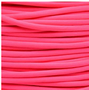
Salmon pink I / II