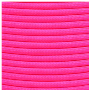
neon pink I / II