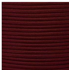
burgundy I / II