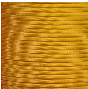
Goldenrod I / II