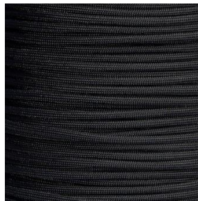
black I / II