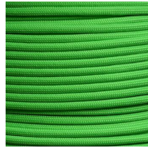
Neon green I / II