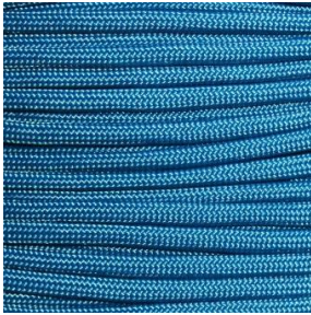
Caribbean blue I / II