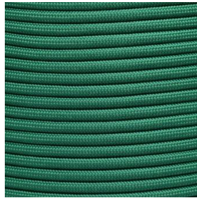
Kelly green II