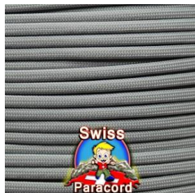
light grey (+)