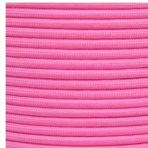
rose pink I / II