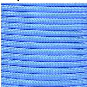
baby blue I / II