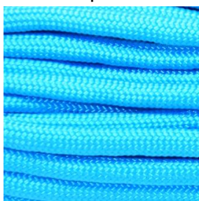
neon turquoise I / II