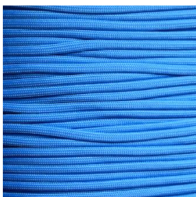
colonial blue II